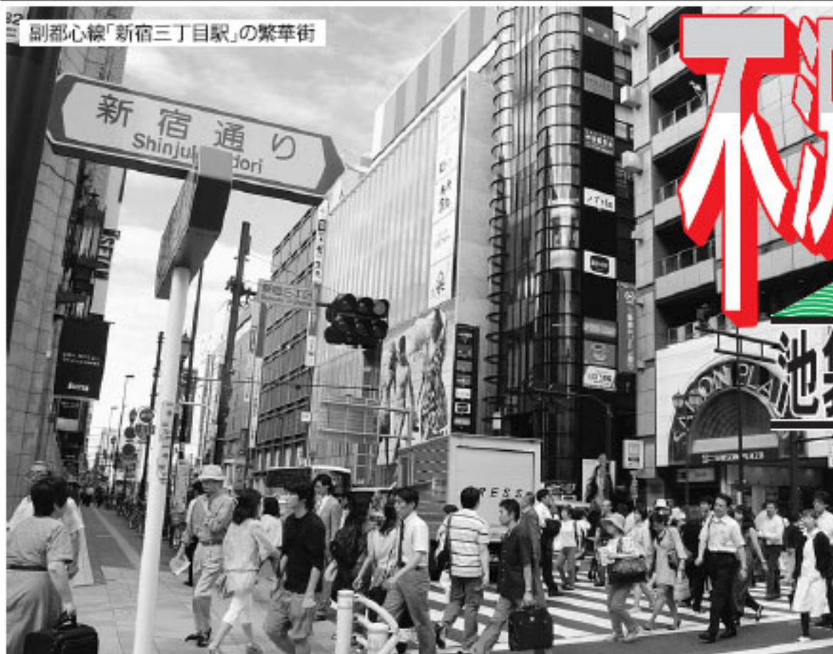
副都心線「新宿三丁目駅」の繁華街

購読料6ヵ月4,000円、毎月5の日発行、創刊55周年 電話3369-6195 FAX3369-0759 (昭和32年12月4日第3種郵便物認可)