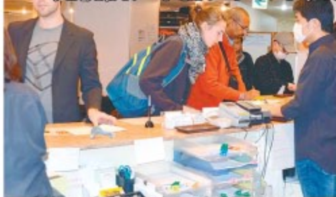
外国人が列をなす新宿区役所前のカプセルホテル

免税品目が化粧品・食品まで拡充された昨年10月以降、中国客の「爆買い」に支えられ百貨店をはじめとする新宿の免税売上は倍増。伊勢丹新宿本店では全体の店舗売上上に占める免税売上が1割に達した。東口の新宿三丁目ではこの4月だけで、外国人観光客をターゲットにした免税・中古ブランド店が2店オープン。ホテルもいまやカプセルホテルまで外国人観光客獲得に力を入れ、空前の需要に沸いている(関連記事5面)。